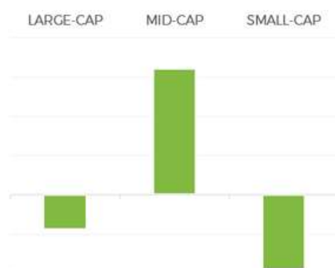
Imagem 2: Classificação da performance pelo market value das empresas

Em relação ao market value das empresas investidas, as Large e Small Caps em sua maioria somaram resultado negativo ao acumulado do mês. O resultado positivo veio de posições em Mid Caps .