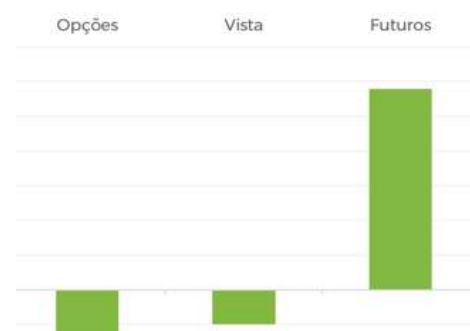
Imagem 3: Atribuição de performance do período por mercado.

No consolidado, operações feitas em Índice Futuro foram responsáveis pelo resultado positivo. Operações no Mercado à Vista e Opções somaram negativo.